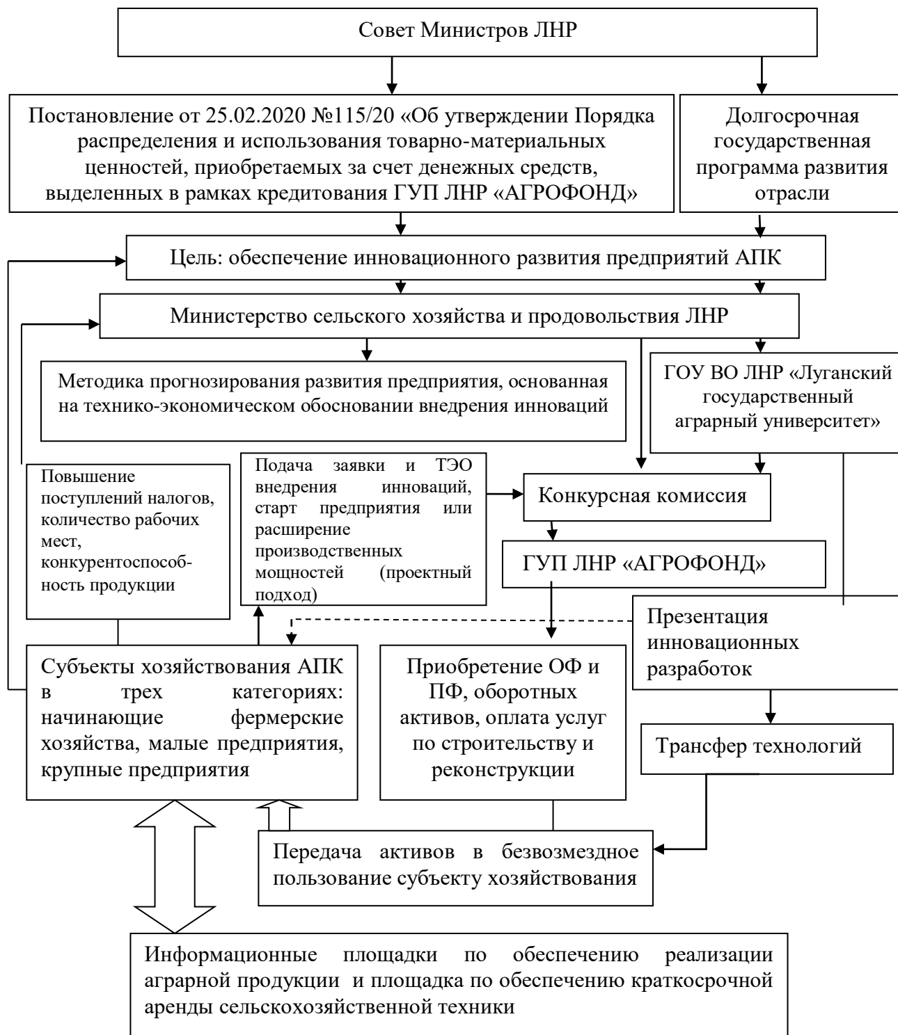
Рисунок 2 – Механизм инновационного развития предприятий АПК в Луганской Народной Республике [предложено автором]

определенного Порядка через «АГРОФОНД». Практическая реализация положений данного документа в отрыве от единой стратегии или программы развития АПК носит фрагментарный характер, но никак не системный. То есть средства кредитования из данного фонда в основном направляются на расширение действующих прибыльных предприятий АПК без учета инновационных составляющих.