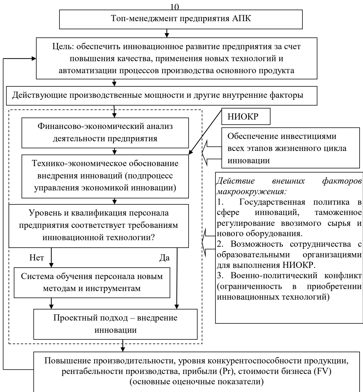
Рисунок 1 – Концептуальное представление взаимосвязей основных элементов механизма инновационного развития предприятия в сфере АПК [предложено автором]

Изучение зарубежного опыта в применении форм и методов, обеспечивающих инновационное развитие предприятий АПК, позволило сделать вывод о том, что предприятия в рамках инновационной деятельности сталкиваются с двумя барьерами: кадровым и финансовым.